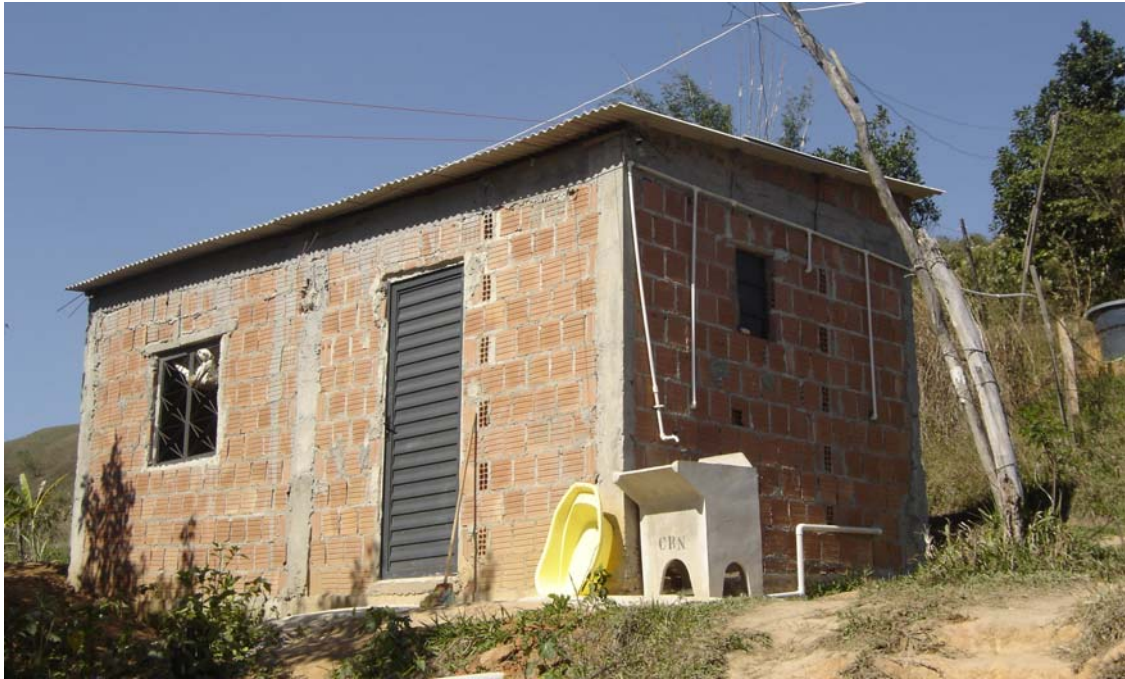
Exemplo de uma moradia - antes da execução de uma Casa Padrão